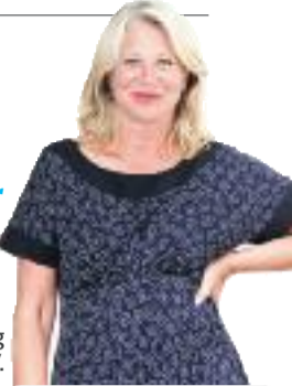
Helena von Zweigbergk.

Helena von Zweigbergk i DN-intervju. Varje fredagsförmiddag i sommar leder hon P1-serien "Oförnuft & känsla".