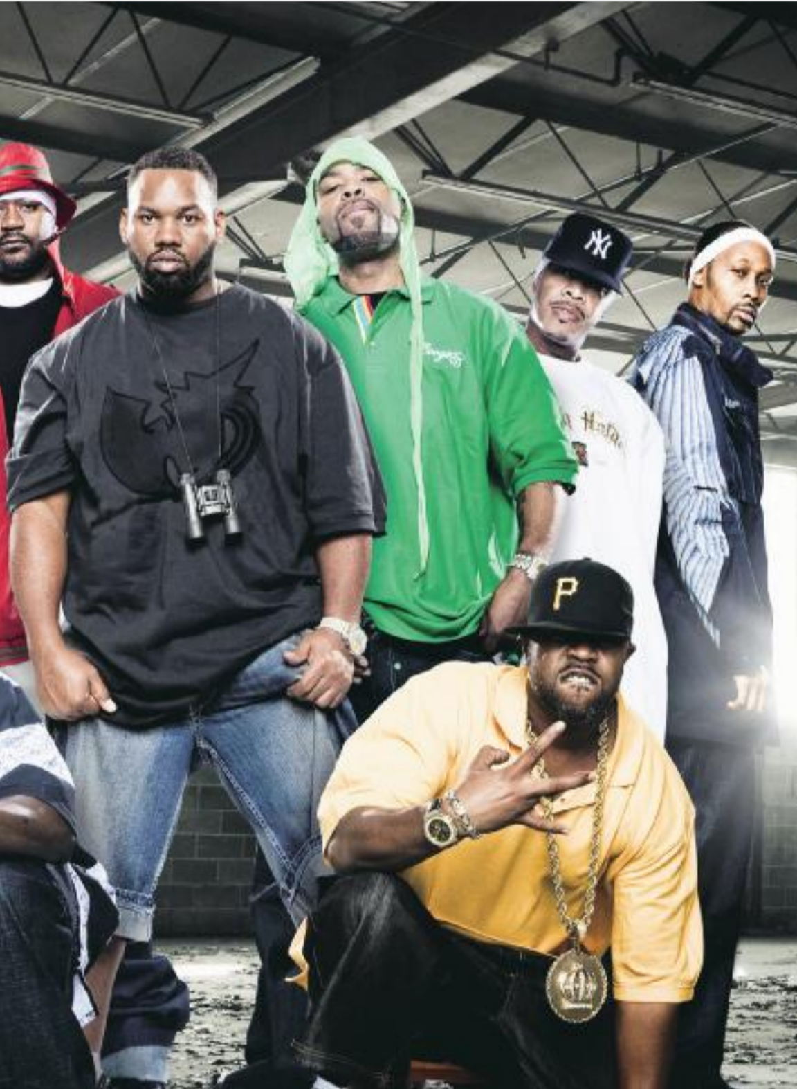
på årets upplaga av Way Out West.